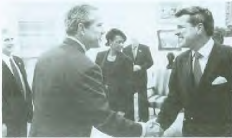
في المكتب البيضاوي مع الرئيس أندرو كار وكوندوليزا رايس ونائب الرئيس